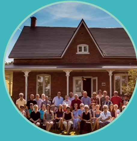
Musée d'histoire du comté de Richmond