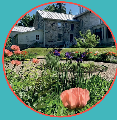
Musée Colby-Curtis Stanstead