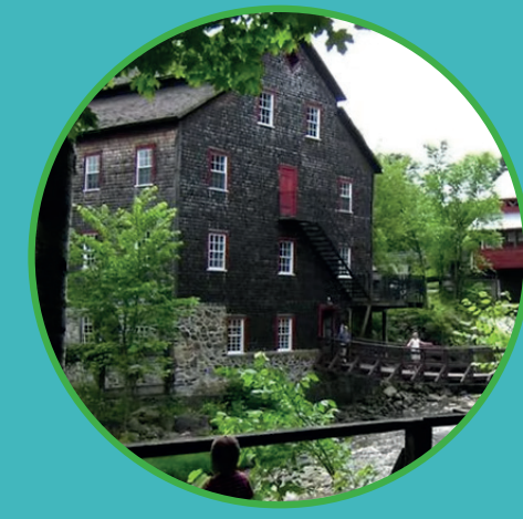
Moulin laine Ulverton