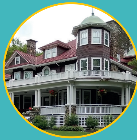
Musée Beaulne Coaticook