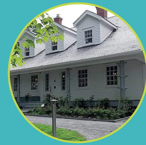
Maison Merry Magog