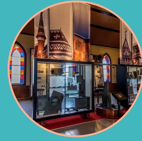
Musée de l'ardoise Richmond